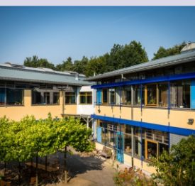
Kleinwachau · Sächsisches Epilepsiezentrum Radeberg Wachauer Str. 30 01454 Radeberg