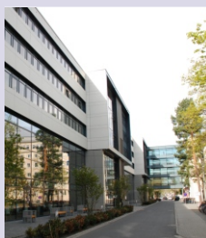
Universitätsklinikum Carl Gustav Carus Dresden Fetscherstr. 74 01307 Dresden