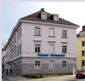
Diakonie Stadtmission Dresden Glacisstraße 44 01099 Dresden