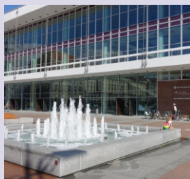
Zentralbibliothek Kulturpalast Schloßstraße 2 01067 Dresden