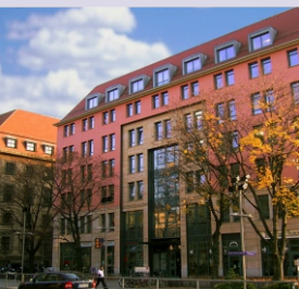
An der Kreuzkirche 6 01067 Dresden