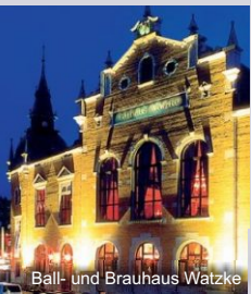
Ball- und Brauhaus Watzke