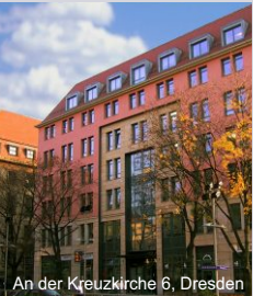
An der Kreuzkirche 6, Dresden