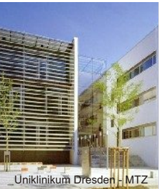
Uniklinikum Dresden - MTZ