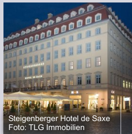
Steigenberger Hotel de Saxe