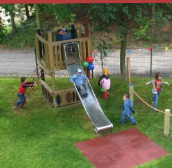
Spielplatz des Krankenhauses

Kleinwachau · Sächsisches Epilepsiezentrum Radeberg gemeinnützige GmbH Fachkrankenhaus für Neurologie Wachauer Straße 30, 01454 Radeberg Tel.: (03528) 431-1311, Fax: (03528) 431-1850 Internet: www.kleinwachau.de E-Mail: fachkrankenhaus@kleinwachau.de