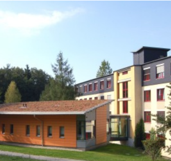
Fachklinik für Neurologie