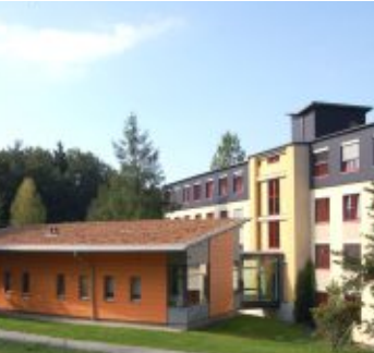
Fachkrankenhaus für Neurologie