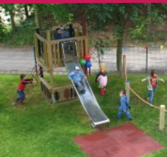
Spielplatz des Krankenhauses