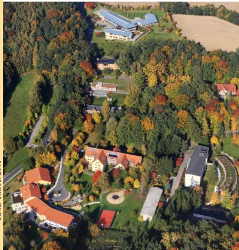
Stand: Oktober 2015