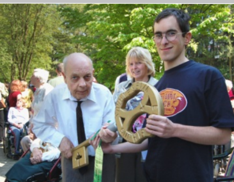
Symbolische Schlüsselübergabe bei der Einweihung des umgebauten Wiesenhauses