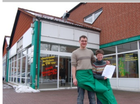
„Empfangskomitee“ der Berufsbildung zur Eröffnung der Außenstelle