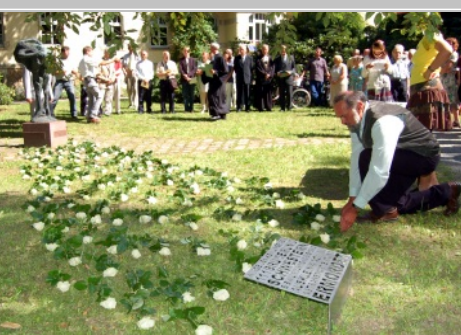
„Rosenspur“ zum Gedenken an die Kleinwachauer Opfer der nationalsozialistischen „Euthanasie“-Tötungsverbrechen