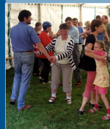
Gartenfest in der Tobiasmühle mit Stolpner Tanzgruppe