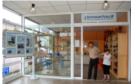
Zweigstelle des Werkstattladens in Radeberg