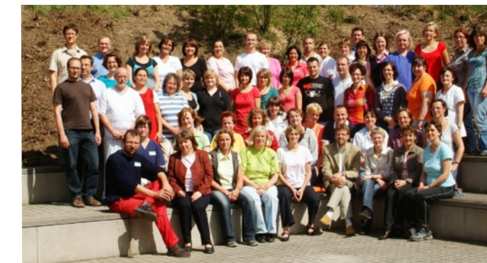
Das Mitarbeiter-Team des Fachkrankenhauses im Frühjahr 2009