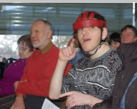
Evangelisation „Das Leben ist schön“