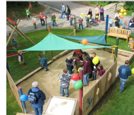
Eröffnung des neuen Spielplatzes an der Kinderstation