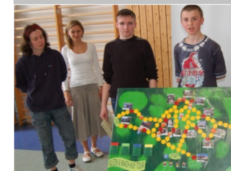
Projektwoche 120 Jahre Kleinwachau