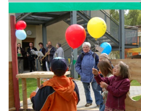
Kinderfest mit Einweihung des neuen Spielplatzes am Krankenhaus