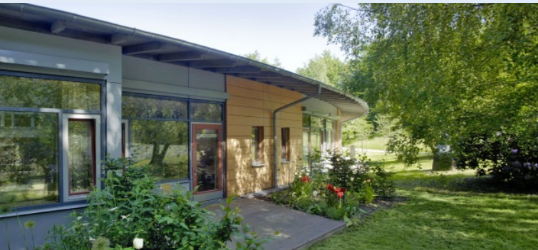
Foto: Krankenhaus - Station für Intensiv-Monitoring

Weltweit ist etwa 1% der Bevölkerung an Epilepsie erkrankt. In Deutschland sind es ca. 800.000 Menschen.