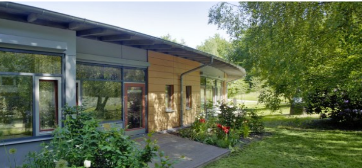
Foto: Krankenhaus - Station für Intensiv-Monitoring

Weltweit ist etwa 1% der Bevölkerung an Epilepsie erkrankt. In Deutschland sind es ca. 800.000 Menschen.