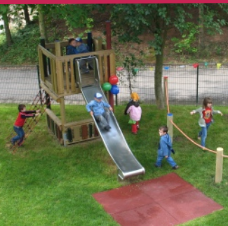
Spielplatz des Krankenhauses

Kleinwachau · Sächsisches Epilepsiezentrum Radeberg gemeinnützige GmbH Fachklinik für Neurologie Wachauer Straße 30, 01454 Radeberg Tel.: (03528) 431-1311, Fax: (03528) 431-1850 Internet: www.kleinwachau.de E-Mail: fachklinik@kleinwachau.de