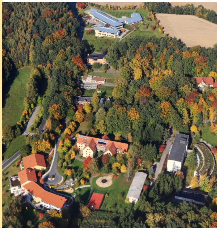
Stand: Juni 2018

kleinwachau Sächsisches Epilepsiezentrum Radeberg